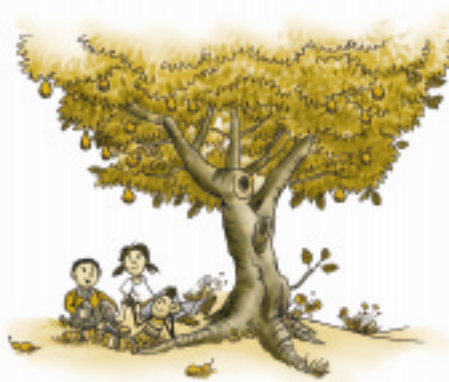
Olli, Lola und Leo sitzen auf der Olli Wiese unterm Birnbaum