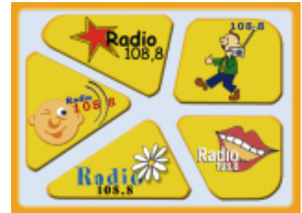
Die Kinder können ein eigenes Logo für Ihren Sender auswählen und einen Trailer selber abmischen