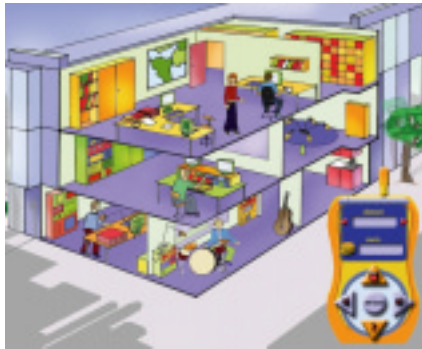
Der Jugendsender „Radio 108,8“

Ausgangspunkt für dieses Projekt war die Überlegung, Kinder und Jugendliche noch vor der heißen Disko-Phase mit dem Thema Hören/Lärm zu erreichen. Dabei sollten die Jugendlichen ganz bewusst nicht über Pädagogen oder Eltern angesprochen, sondern gezielt durch ein altersgerechtes, modernes Medium und ein spannendes Thema direkt erreicht werden.