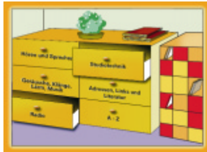
Ein großes Archiv, das auch für Lehrer und Eltern nutzbar ist, befindet sich ebenfalls auf der Spiel-CD.

Informationen verstecken sich sowohl in den Aufgabenstellungen als auch in den Spielen und Abenteuern. Mal sind sie als