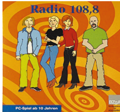
Das PC-Spiel „Radio 108,8“

Das PC-Spiel ist ein Medium, das die Qualitäten des Internet mit denen der „Games“ verknüpft und einen ganz besonderen Reiz