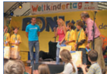
Radio108,8-Kinder mit Nationalspieler Christoph Metzelder auf der LILIPUZ-Bühne

Auf der Kinder stark machen - Bühne der BZgA am Heumarkt stand Singa vom KIKA den Reporterkindern Rede und Antwort, auf der WDR-Bühne im Rheingarten durften sie live in der LILIPUZ-Sendung von ihrem Job als Reporter erzählen, einem waschechten Astronauten die Hand schütteln und Fußballnationalspieler Christoph Metzelder ausfragen.