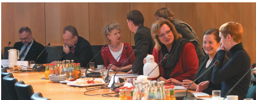
Delegierte auf der Jahresversammlung 2009