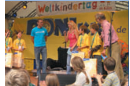
Radio108,8-Kinder mit Nationalspieler Christoph Metzelder auf der LILIPUZ-Bühne