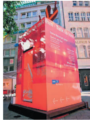
Die WDR 3 Sprechbox zum Papstbesuch im August 2005