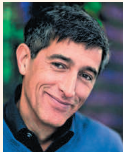
Ranga Yogeshwar | Moderator

ich, dass der Geist der dritten Radios, wo auch immer sie sind in Deutschland, erhalten bleibt, nämlich immer wieder Neues und Interessantes, auch für Intellektuelle, für intellektuell interessierte Menschen zu bringen und das ist beim WDR 3 sicher der Fall und soll der Fall bleiben!