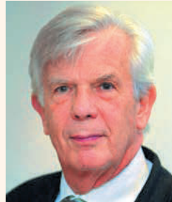
Christoph von Dohnányi | Dirigent

Ich bin Dirigent, ich habe hier am WDR das WDR Sinfonieorchester für fünf Jahre geleitet, in den 60er-Jahren und habe es sehr geliebt und viele große Dinge hier zum ersten Mal erlebt. Den WDR 3 kenne ich natürlich. Und ich muss Ihnen sagen, alle Dreis, wo immer die Dreis in den Rundfunkstationen sind, höre ich am liebsten. Das interessiert mich unglaublich. Insofern gratuliere ich WDR 3 ganz herzlich dazu, was sie an Bildung, an Elan und an Freundschaft und zur Musik und zur Kultur tun in diesem Bereich und hoffe, dass es immer weiter so geht. Wünschen tu